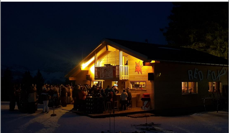
Vollmond-Skinacht mit Après-Ski beim Red Fox

Gegenüber dem Vorjahr verzeichnete die Gastronomie einen Umsatzrückgang von -3%. Hierbei gilt es zu berücksichtigen, dass die Eventserie der zweiten Märzhälfte mit Fuchstivalino, Fuchstival und Monster Waterslide coronabedingt nicht durchgeführt werden konnte. Die im Vorjahr errichtete Après-Ski Hütte Red Fox setzte ihre Erfolgsgeschichte fort und vermochte den Umsatz weiter auszubauen. Selbstverständlich half auch hier das hervorragende Weihnachts-/Neujahrgeschäft mit traumhaften Wetterbedingungen.