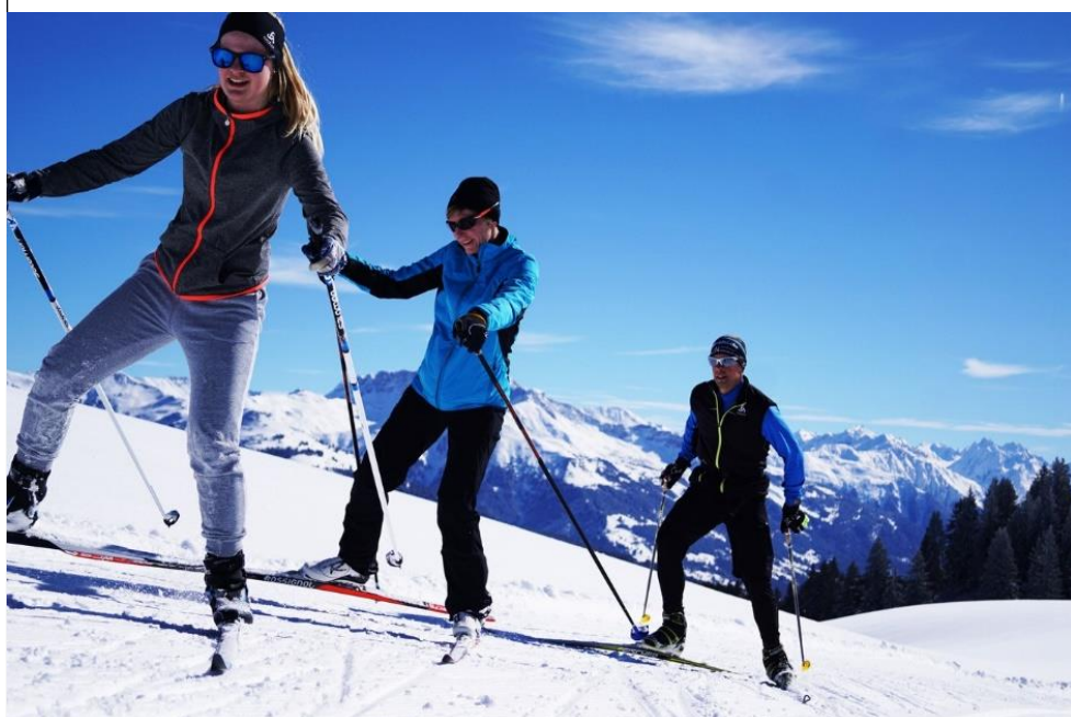
„Engadiner“ auf Gräsch-Danusa

Unsere Engadiner Guerilla-Marketing-Aktion anfangs März schlug unerwartet hohe Wellen. Nach der Absage des traditionellen Engadiner Skimarathons luden wir alle angemeldeten Teilnehmer am Tag des Engadiners zu einem Gratis-Langlaufstag auf Gräsch-Danusa ein. Damit sollten unzählige Trainingskilometer nicht ganz umsonst gewesen sein, und die Athleten hatten trotzdem das Vergnügen, auf 1800m ü.M. dem Langlaufsport zu frönen. Flankiert wurde unsere Charme-Offensive durch eine Gastrozene im Engadiner Stil und durch den Ausschank von Engadiner Gerstensaft der Bieraria Tschlin.