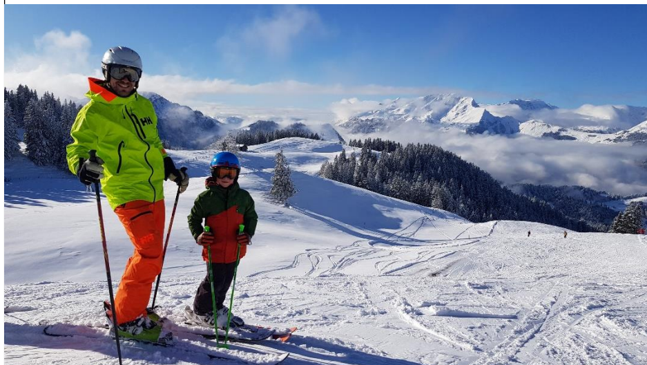
Saisoneröffnung bei strahlend schönem Wetter und tollen Bedingungen

Im Quervergleich verzeichneten wir ein geringeres Minus als der Durchschnittswert der Bündner Bergbahnen von -15.3%. Dabei muss aber berücksichtigt werden, dass insbesondere den grossen Ski-gebieten durch die behördliche Schliessung wegen Covid-19 das ganze Frühlingsgeschäft abhanden kam.