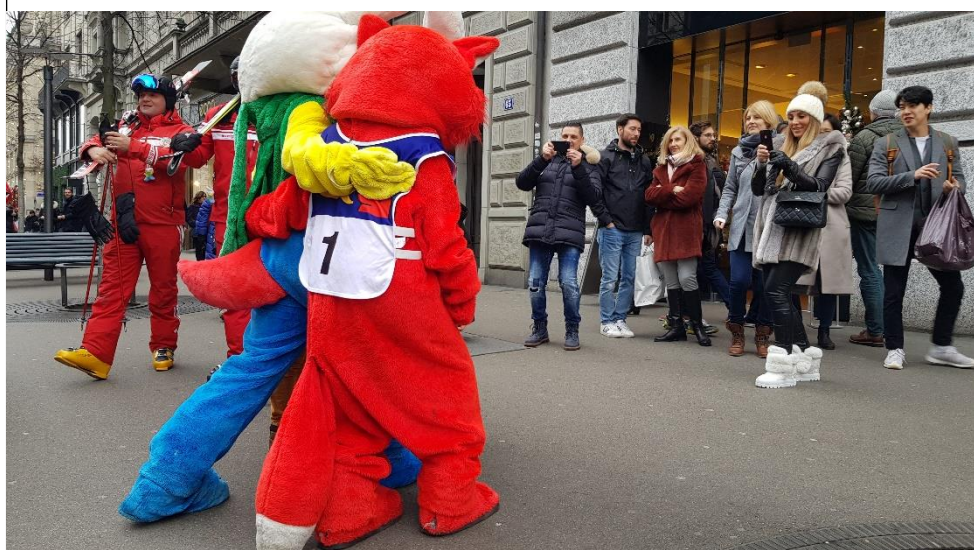
Die Schweizer Skischule Grüşch-Danusa zu Gast in Zürich

Des Weiteren zogen unsere Skilehrer am Sonntagsverkauf vom 1. Dezember in Vollmontur vom Bahnhofplatz zum Paradeplatz und wurden zum Sujet zahlreicher Selfies von spontanen Shoppfern. Nicht fehlen durfte natürlich der Danusa-Fuchs und der Snowli, welche zahlreichen Kindern aber auch den Erwachsenen ein Lachen ins Gesicht zauberten.